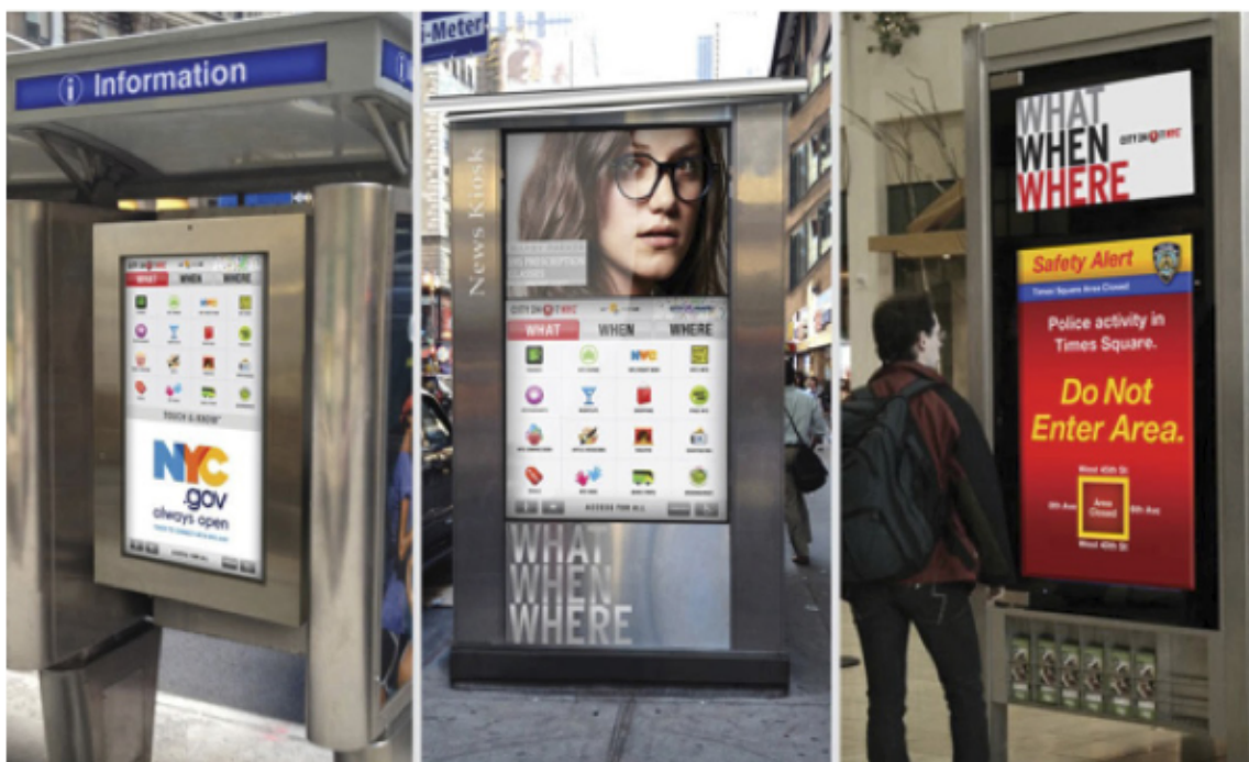
Figura 3: City 24/7 Platform Informs, Protects, Revitalizes [Mitchel et al., 2013].

telas inteligentes podem ser acessadas através de Wifi em smartphones [Falaki et al., 2009], tablets e computadores portáteis nas proximidades. Um dos objetivos das telas inteligentes é informar as pessoas instantaneamente com informações relevantes em suas proximidades. Logo, a TIC, por meio desses dispositivos inteligentes, deverão comunicar aos cidadãos informações importantes em tempo real, como, por exemplo: horário de transporte público, postos de atendimento policial e bombeiros, eventos, parques e atividades outdoor, entre outros.